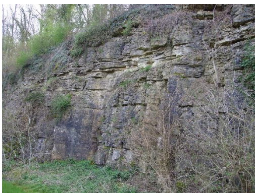
Schichtung im Dolomit