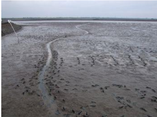
Schlickwatt Nordsee (Husum, D)

Die Sedimentation im Meer zeigen die folgenden Beispielbilder aktueller Strände und Meeresböden bei Ebbe. Die Energie der Wellen an der Küste nimmt von oben nach unten zu, weswegen auch die Größen der Körner von oben nach unten zunehmen.