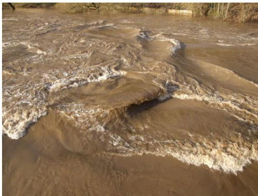
Die vielen transportierten Partikel färben das Wasser der Sauer bei Hochwasser braun.

Diese Bilder aus der Region zeigen den Transport von Feststoffen: