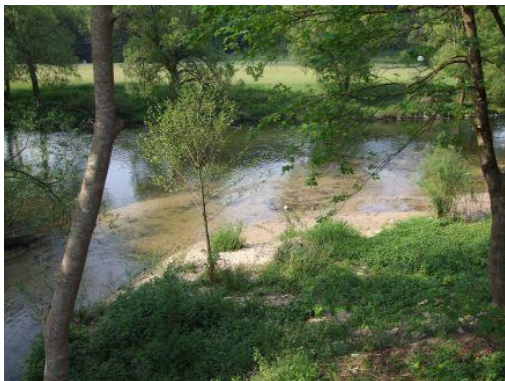
An der Mündung der Schwarzen Ernz in die Sauer hat sich Sand abgelagert.