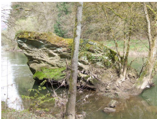
Ein Sandsteinblock in der Sauer, der auch bei der stärksten Strömung nicht fortgespült wird. Er wird mit der Zeit von anderen in der Strömung transportierten Partikeln glattgeschliffen.