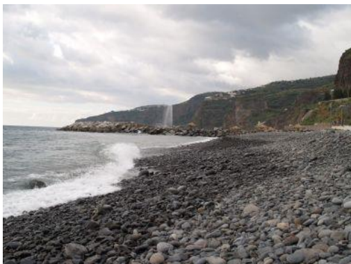
Kiesstrand (Funchal, Madeira, P)

Auch gelöste Stoffe wie Kalk oder andere Salze werden ins Meer transportiert. Wenn viel Wasser aus dem Meer verdunstet, wird das Meerwasser immer salziger. Verdunstet richtig viel Wasser, können nicht alle Stoffe gelöst bleiben. Zunächst wird der gelöste Kalk am Meeresboden zu einer dicken Schicht festem Kalkstein - ein bisschen so wie in der Kaffeemaschine...Die Schalen gestorbener Lebewesen wie Kalkalgen, Muscheln oder Korallen, die aus Kalk bestehen, haben ebenfalls Anteil am Aufbau dieser Gesteine. Nach dem Kalk bilden sich bei weiterer Verdunstung noch andere Minerale wie Gips und Kochsalz.