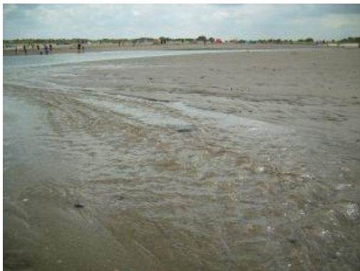
Sandstrand (Cadzand, NL)