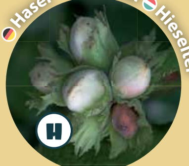
● Hasel ● Noisetier ● Hieselter