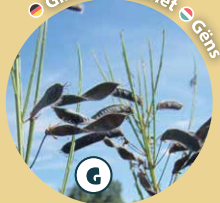
● Ginster ● Genêt ● Gëns