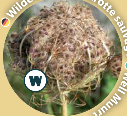
● Wilde Möhre ● Carotte sauvage ● Weill Muurt

Früchte, die im Fell eines Tieres hängen bleiben